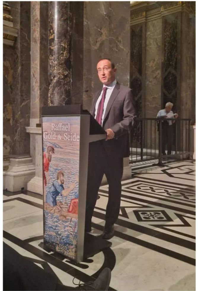
Eröffnung der Ausstellung Raffaël - Gold & Seide | Flanders