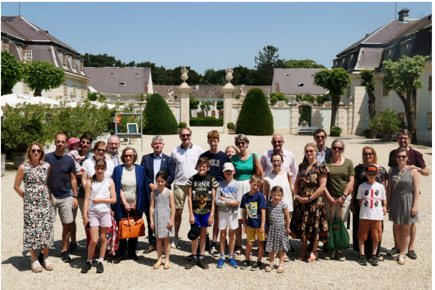
ÖBG-Familienausflug Schloss Halbturn

27. Jahrgang / Nr. 75 / 10.2023 – 03.2024